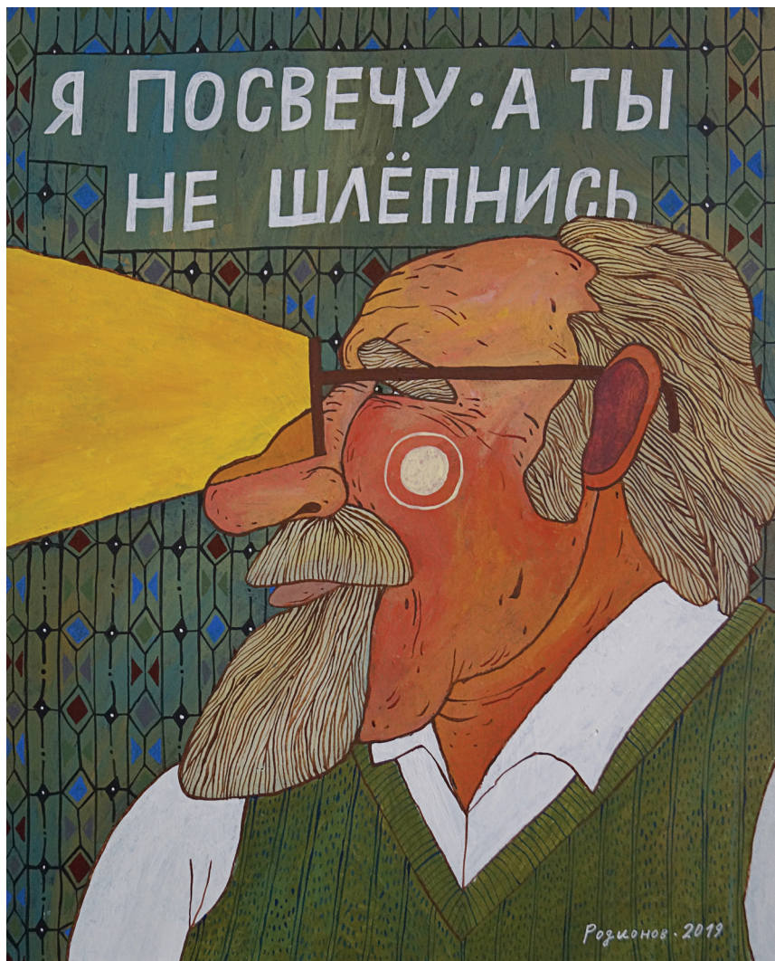
Я посвечу, а ты не шлёпнись. 2019 Оргалит, темпера, акрил 40x50 см