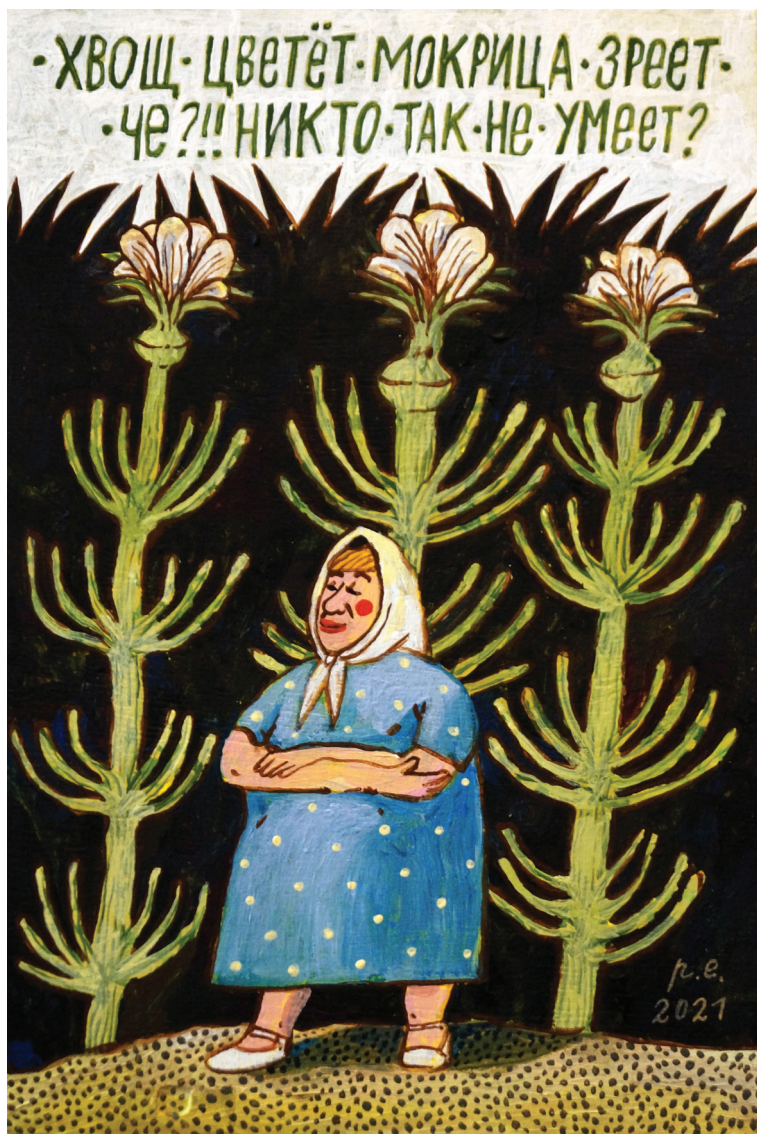
Хвощ цветёт, мокрица зреет. Чё?!! Никто так не умеет? 2021 Фанера, темпера, акрил 20x30 см