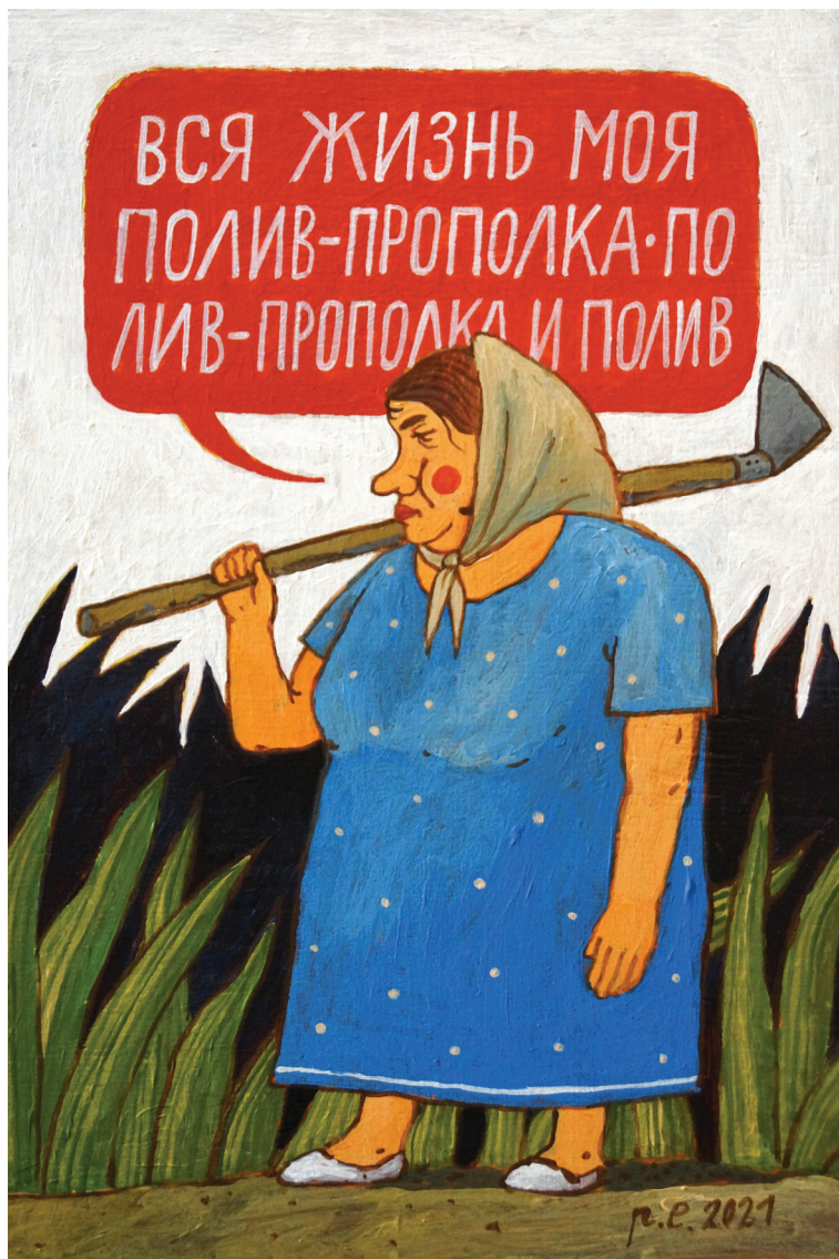
Полив. Прополка. 2021 Фанера, темпера, акрил 20x30 см