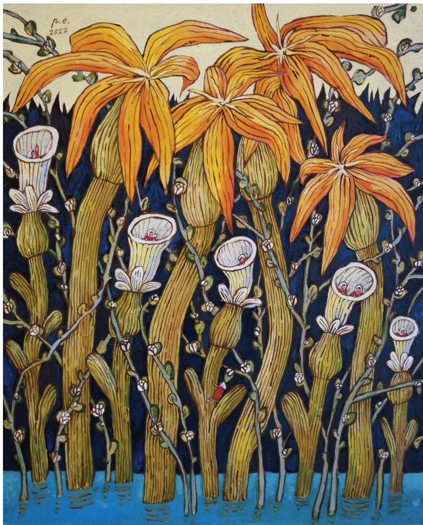
А у нас эта... Как её... Сиеста! 2022 Оргалит, темпера, акрил 40x50 см