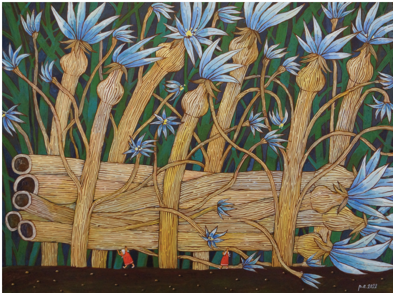
А это не та полянка! 2021 Фанера, темпера, акрил 30x20 см