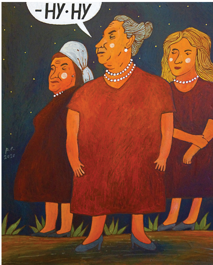
-НУ·НУ. 2020 Оргалит на подрамнике, темпера, акрил 40x50 см