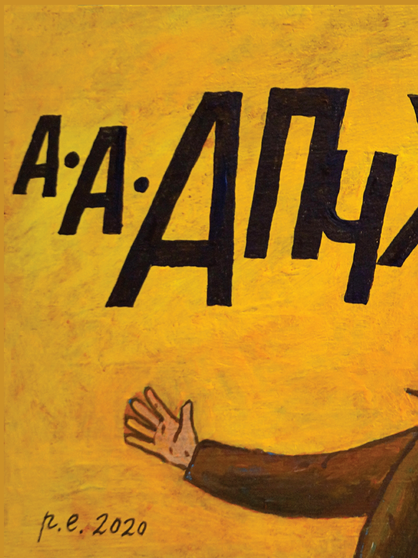
А-а-апчи!!! 2020 Дерево, темпера, акрил 30x20 см