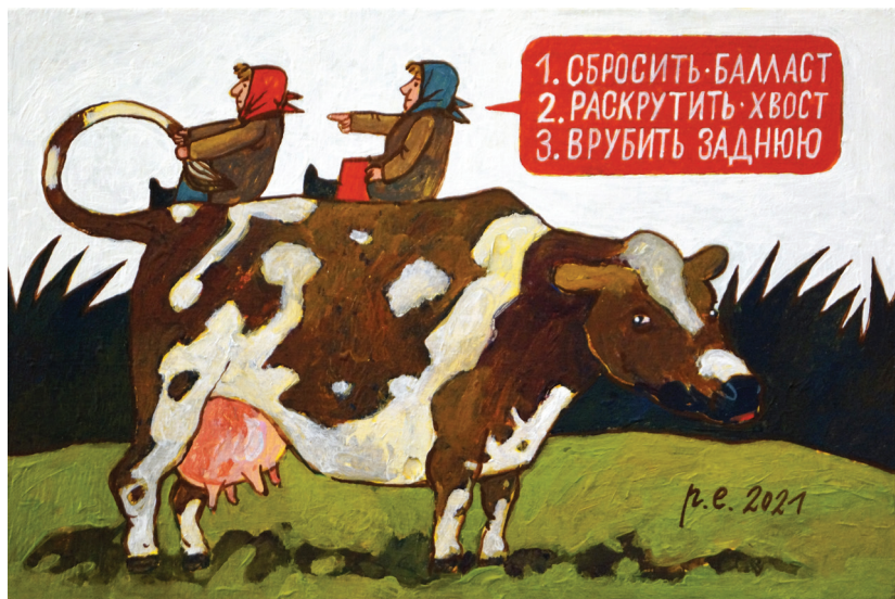
Общайся. 2021 Оргалит, темпера, акрил 30x20 см