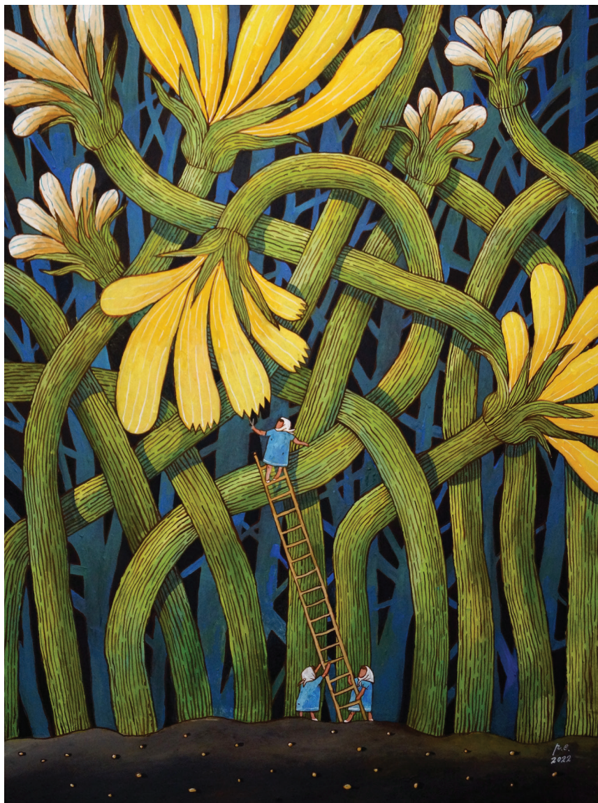
Парикмахеры цветов. 2022 Оргалит на подрамнике, темпера, акрил 60x80 см