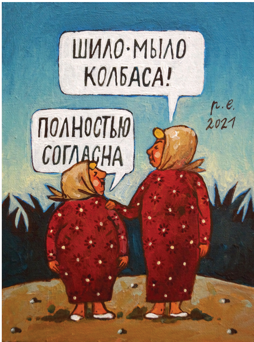
О, это чудное слово КОНСЕНСУС. 2021 Холст на картоне, темпера, акрил 18x24 см