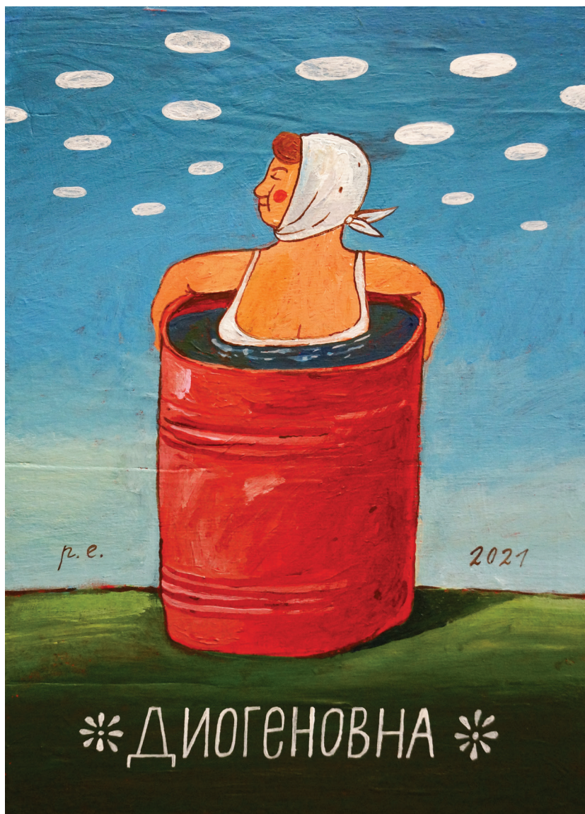
Диогеновна. 2021 Фанера, темпера, акрил 25x35 см