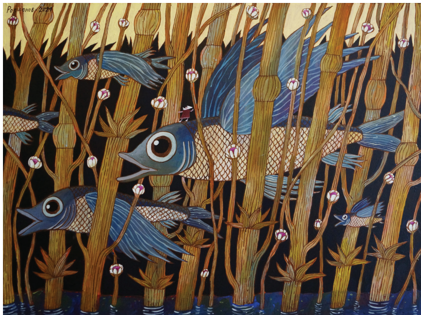
Летим! 2021 Оргалит на подрамнике, темпера, акрил 80x60 см