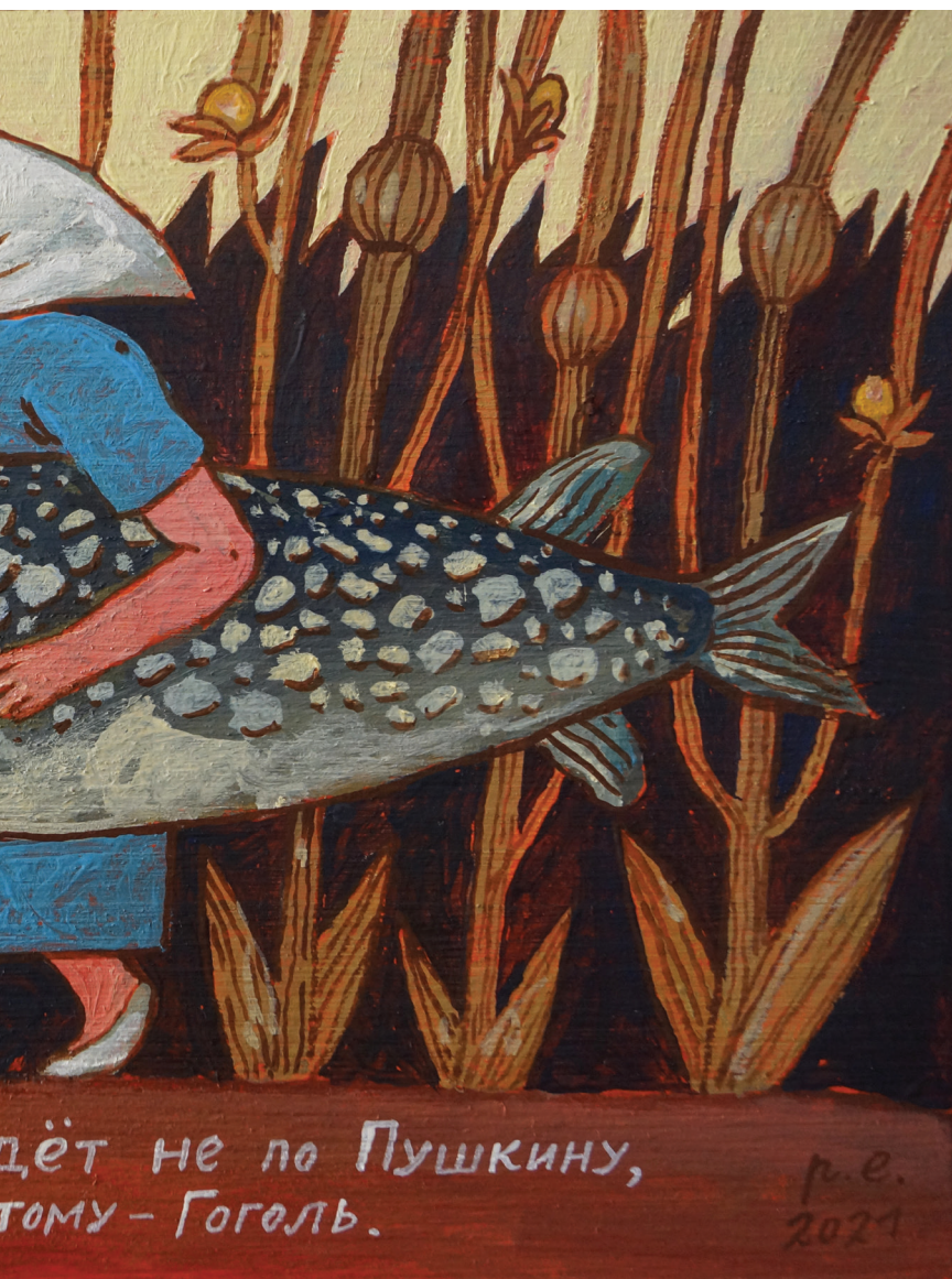
Дерево, темпера, акрил 30x20 см