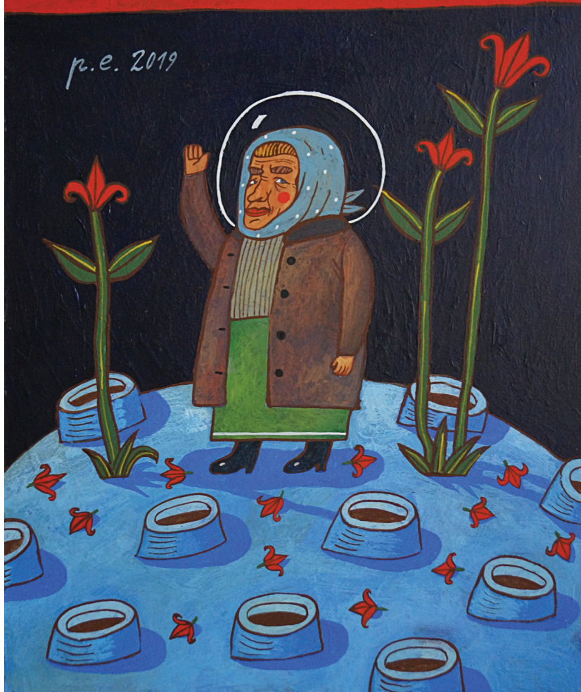
Если и валить, то токма на Венеру. 2019 оргалит, темпера, акрил 25x35 см