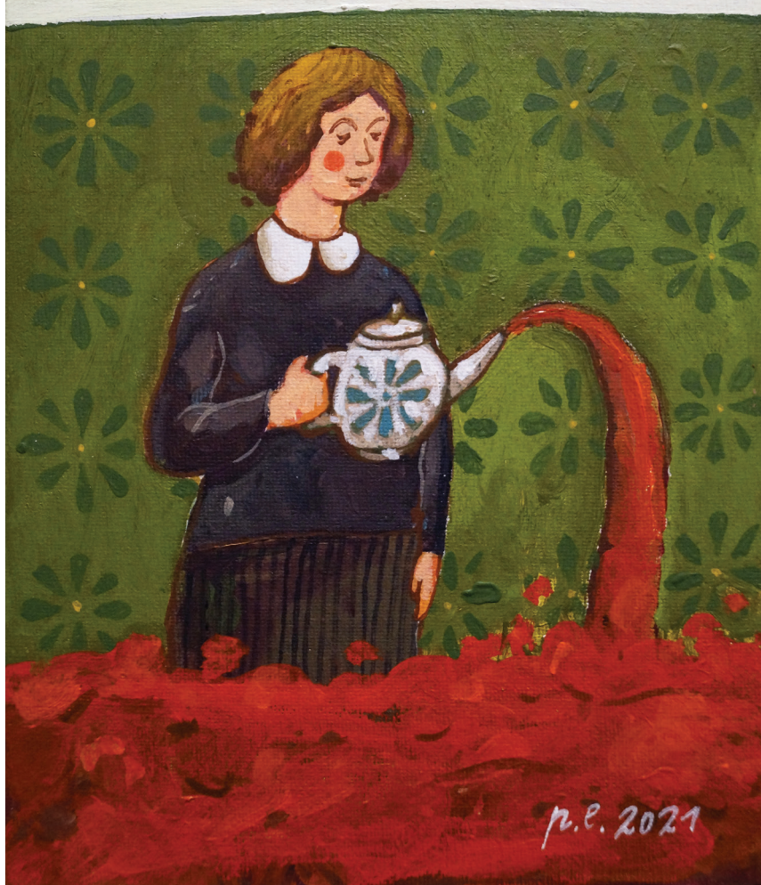
Пейте, люди, пейте чай! 2021 Холст на картоне, темпера, акрил 18x24 см